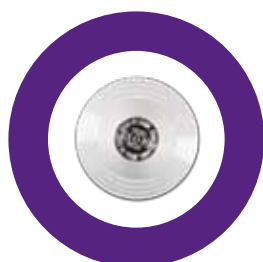
Détecteur de fumée optique

déclenche une alarme lorsqu'il y a du mouvement dans la salle. Le détecteur peut être facilement installé à plusieurs endroits. Le détecteur de mouvement est aussi protégé à l'arrachement.