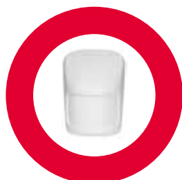
Détecteur de mouvement

rapporte sur l'ouverture des portes et fenêtres par des intrus. Le détecteur comporte un contact magnétique, qui déclenche une alarme lorsque la partie magnétique sur une porte ou une fenêtre est éloignée du contact. Le détecteur protège également contre son arrachement.