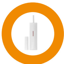
Détecteur d'ouverture des portes

est utilisée pour l'autorisation de l'utilisateur. Il arme et désarme en étant simplement appliquée au lecteur RFID AZ-10D. Chaque badge RFID utilise son propre code et le système peut facilement distinguer qui a utilisé celui-ci. Ce badge peut être facilement ajouté à un trousseau de clés.